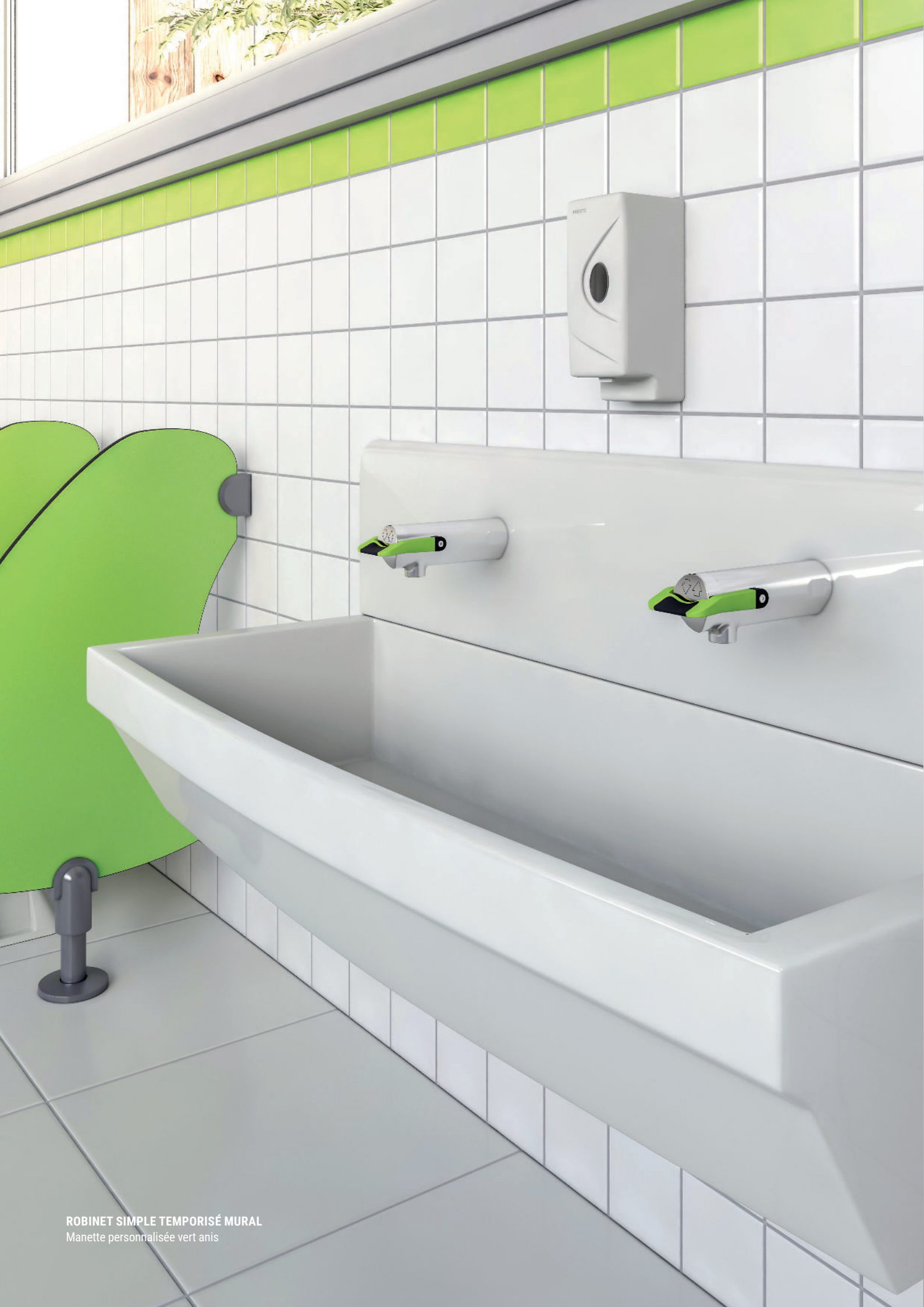
ROBINET SIMPLE TEMPORISÉ MURAL Manette personnalisée vert anis